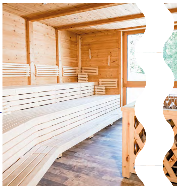
Saunen und Dampfbäder